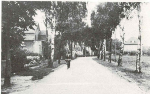
Wird es wieder so romantisch wie vor 50 Jahren? Haller Straße 1941